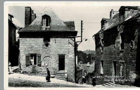
Les anciennes maisons en haut de la rue Vieille-Ville. En descendant la rue, on arrive au Blavet.

C'est en 1060 que la motte castrale d'« Henpont » située rive droite au-dessus du Blavet est mentionnée. Depuis la motte, vers le prieuré de Kerguelen, se développe le quartier de Vieille-Ville (1). Il abrite d'intéressantes maisons anciennes, l'hôtel Lhermitte, mais aussi plus récentes, datant notamment des années 60 comme la maison Caillard, rue du Vieux-Château.